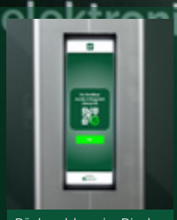
Rückmeldung im Display nach erfolgreicher Prüfung